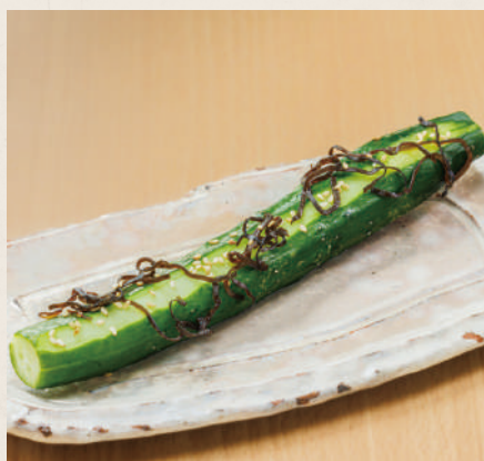
きゅうり1本漬け 380円