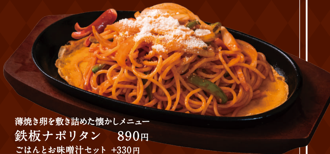
薄焼き卵を敷き詰めた懐かしメニュー 鉄板ナポリタン 890円 ごはんとお味噌汁セット +330円