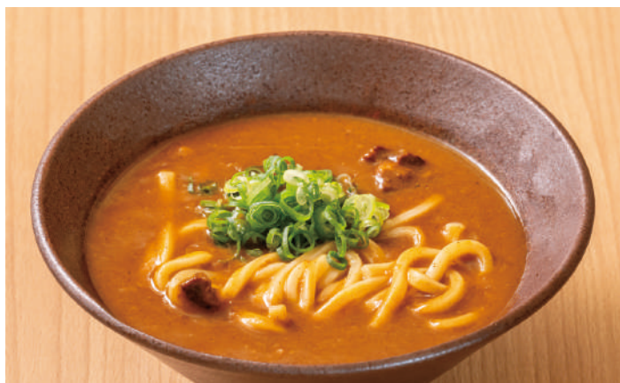
各種スパイスと和風出汁を合わせた かつお出し香る豚カレーうどん 950円