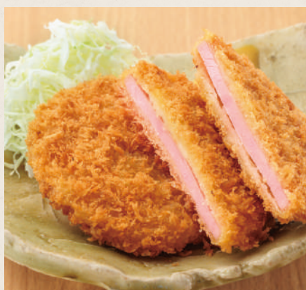
ハムカツ (2枚) 600円