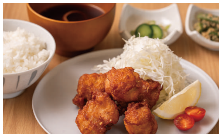
人気No.1の定番メニュー からあげ定食