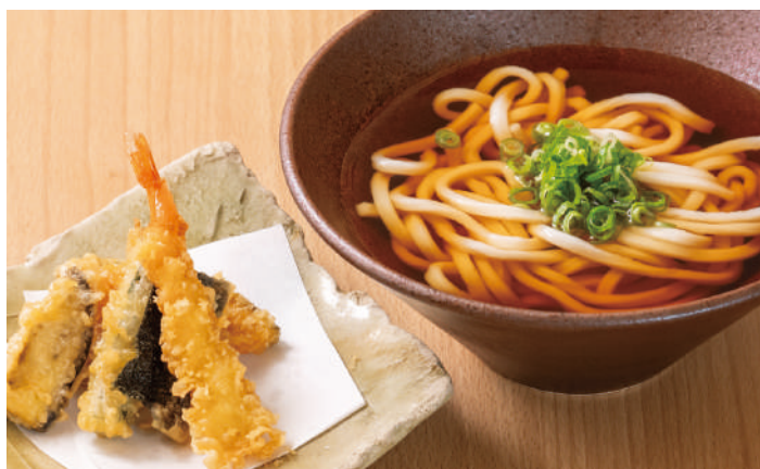
自慢の天ぷらと一緒にどうぞ 天ぷらうどん・そば 1,100円