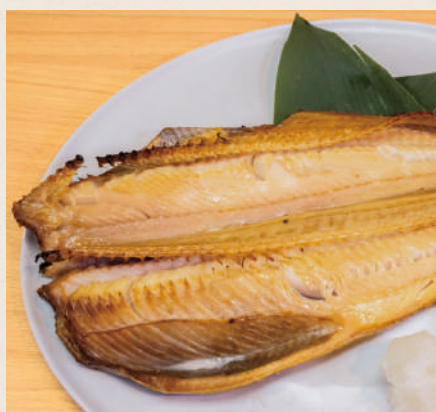
海産物問屋まるかつの おっきなホッケ開き 1,200円