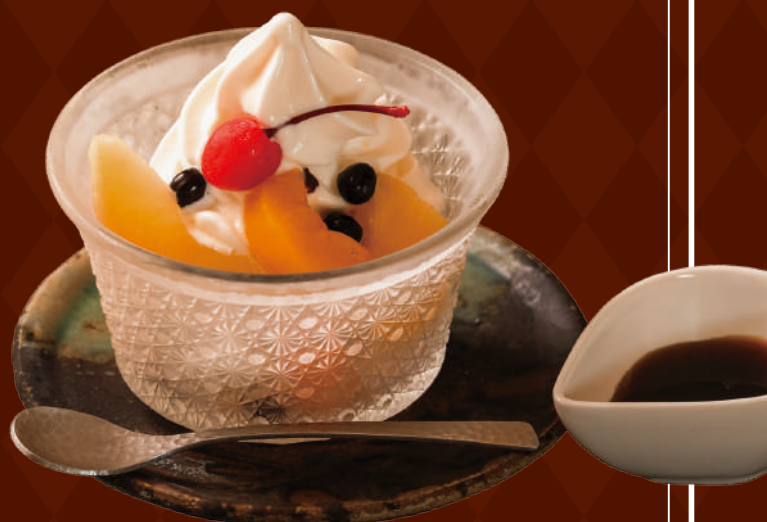
喫茶店の甘味といえば クリームあんみつ 680円