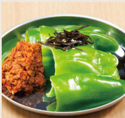
冷やしピーマン 480円