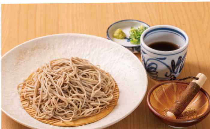
お風呂上りにさっぱりと ざるうどん・そば