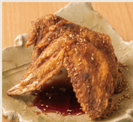
おっきな手羽先 (1本) 220円