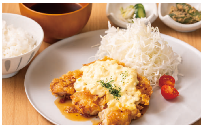
タルタルソースが決め手 チキン南蛮定食