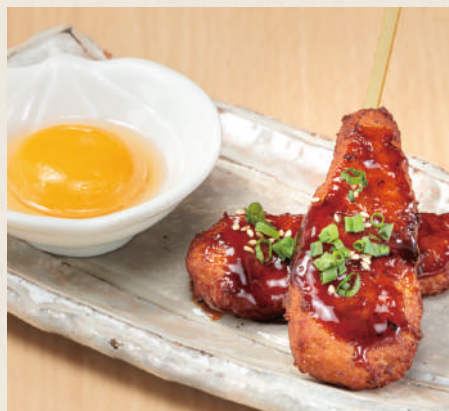
月見つくね (2本) 600円