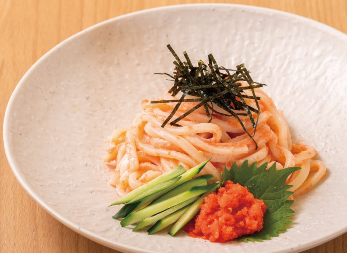
特製のめんたいこソース めんたいうどん