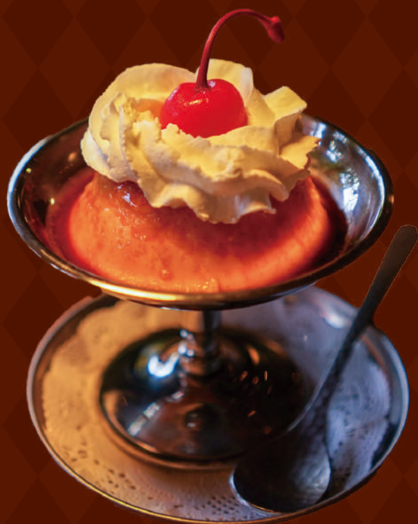
ほろ苦いカラメルカラメルソースをかけた 昔ながらの固めプリン 600円