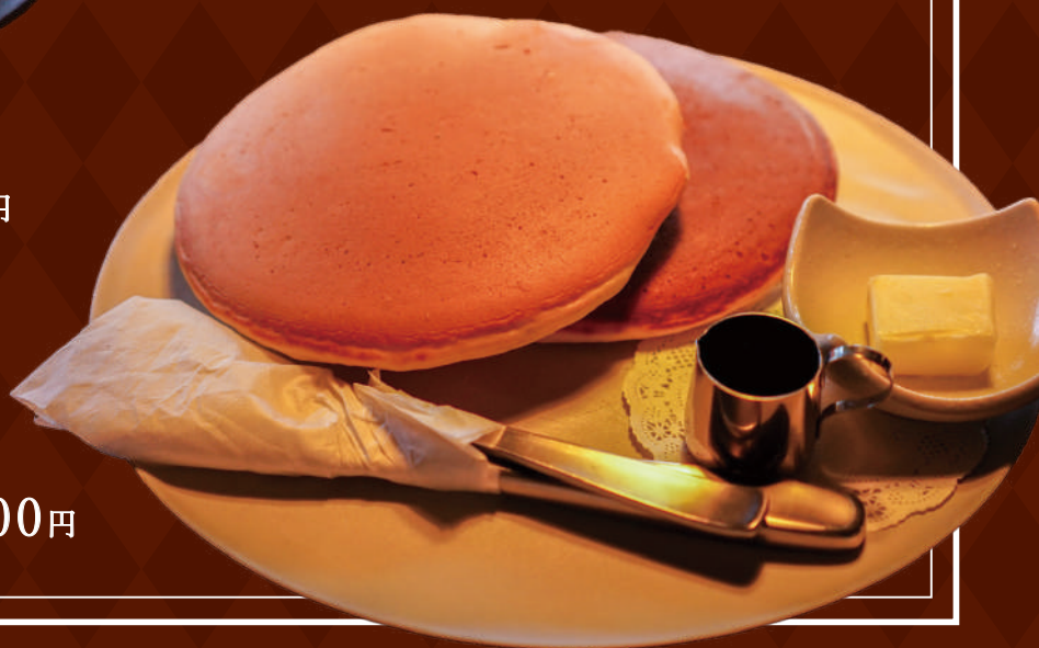
昭和の定番なつかしの ホットケーキ 700円