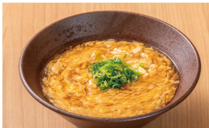
心も体も温まるほっこりメニュー 玉子とじうどん 800円