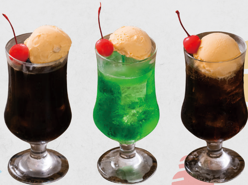
喫茶店の定番ドリンク 各種フロート (コーラ・メロン・コーヒー) 450円