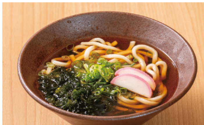
磯の風味豊かな一品 あおさうどん 800円