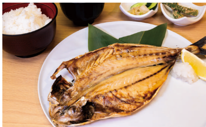
海産物問屋まるかつの アジ干物定食