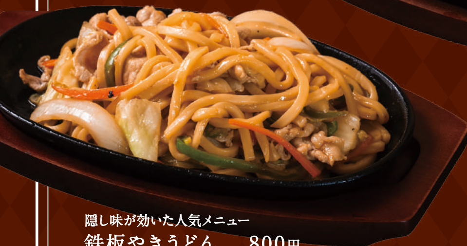
隠し味が効いた人気メニュー 鉄板やきうどん 800円 ごはんとお味噌汁セット +330円