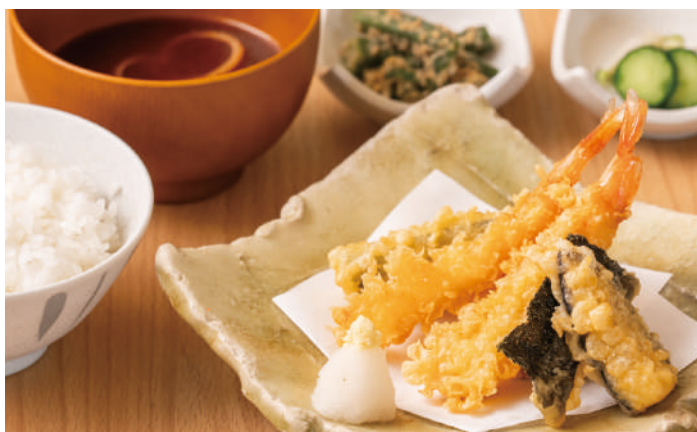
自慢のサクサク天ぷら 天ぷら定食 (海老2本入り)