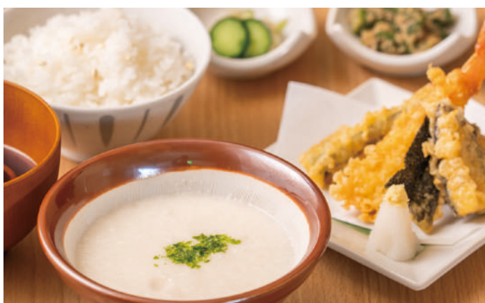
天ぷらも付いてボリューム満点 麦めしとろろ定食