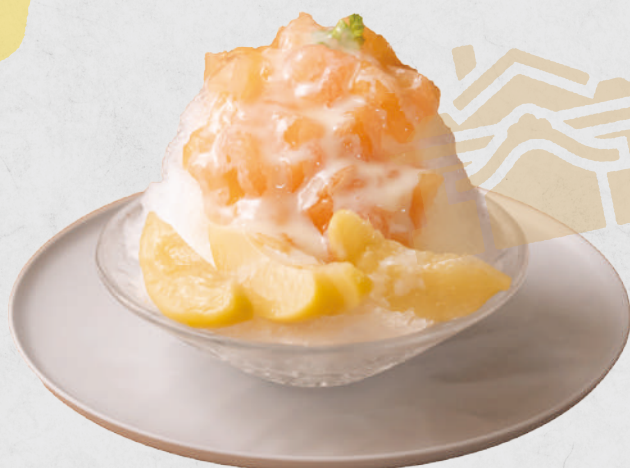
季節にあわせたフルーツかき氷 季節のかき氷 800円 かき氷 抹茶 700円 かき氷 練乳いちご 700円