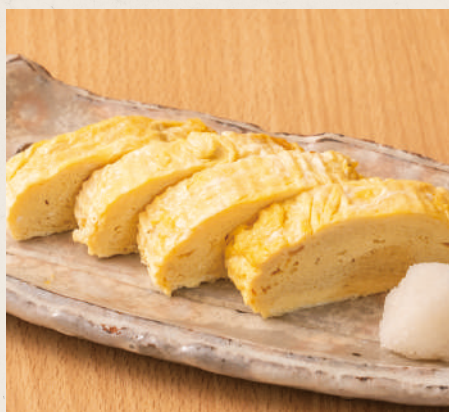
お店で手作りだし巻き卵 450円