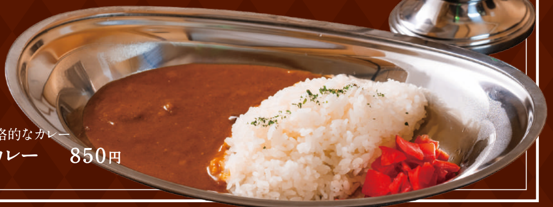
スパイスを効かせた本格的なカレー スパイス香る豚カレー 850円