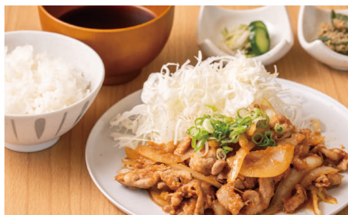
ご飯がすすむ定食メニュー 豚しょうが焼き定食