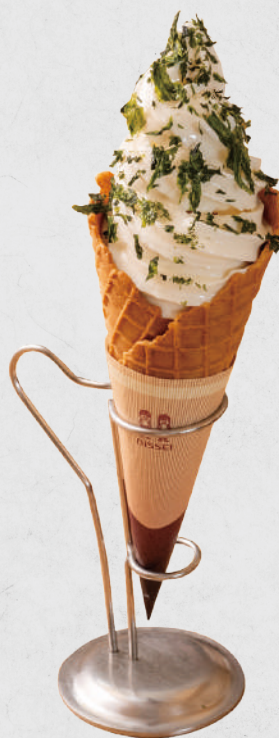
海の恵みをトッピング あおさ 600円