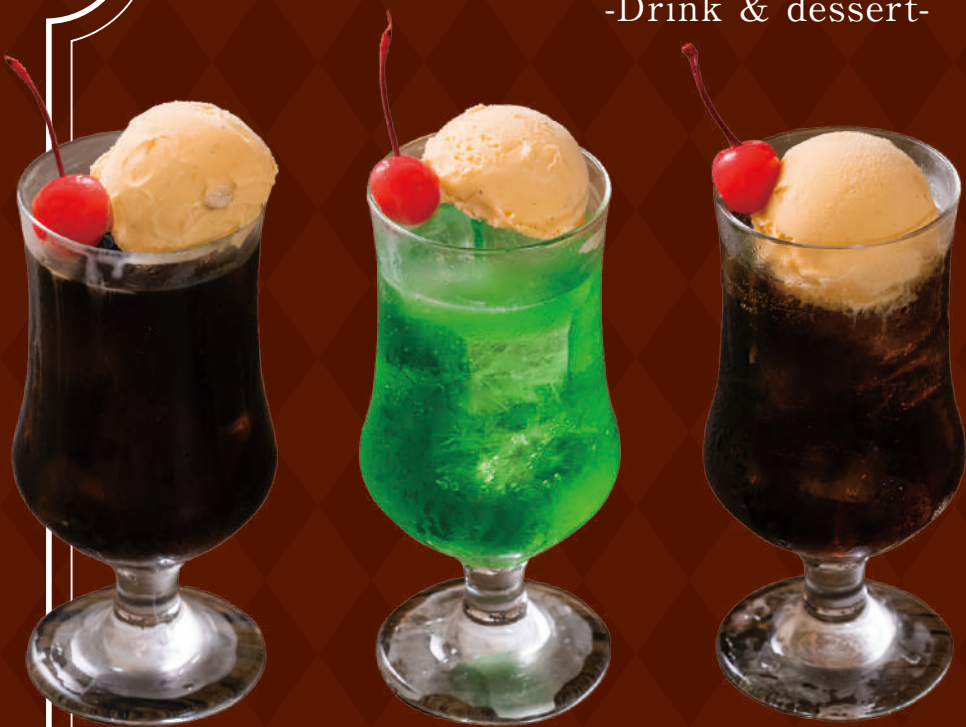
喫茶店の定番ドリンク 各種フロート 450円 (コーラ・メロン・コーヒー)