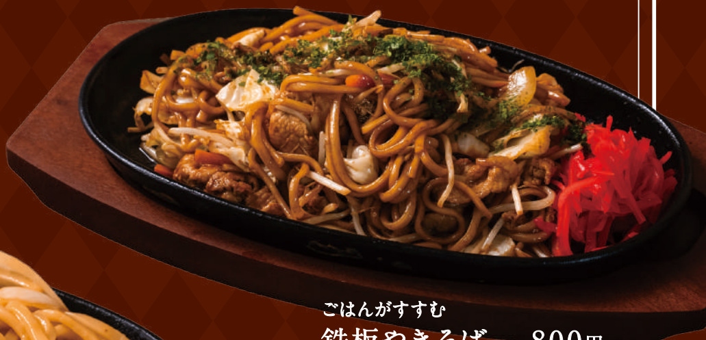
ごはんがすすむ 鉄板やきそば 800円 ごはんとお味噌汁セット +330円