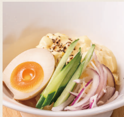
できたてポテトサラダ 450円