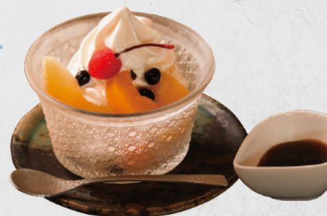
喫茶店の甘味といえば クリームあんみつ 680円