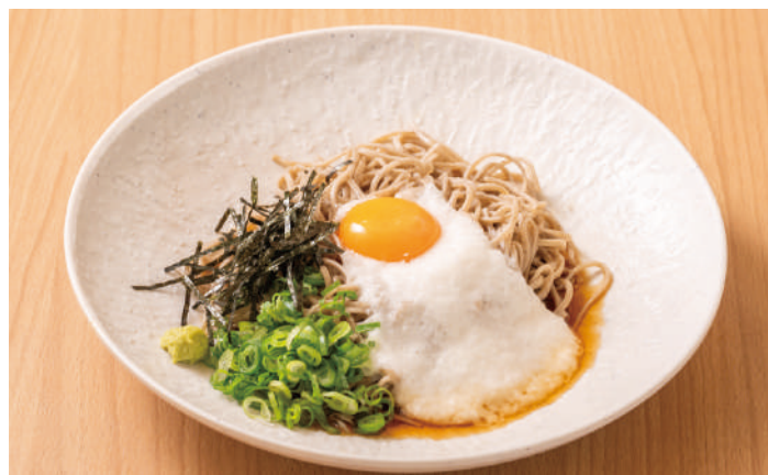
とろろをプラスしてスタミナアップ やまかけのうどん・そば