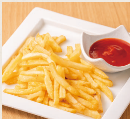
ポテトフライ 青のりトッピング +50円