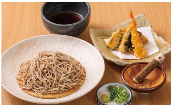
サクサクの天ぷらを別添えて 天ざるうどん・そば