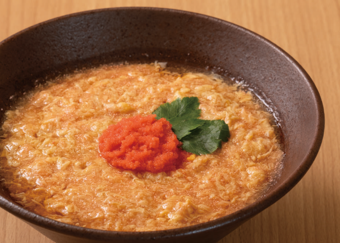
明太子のプチプチ触感が楽しい 明太餡かけ玉子とじうどん